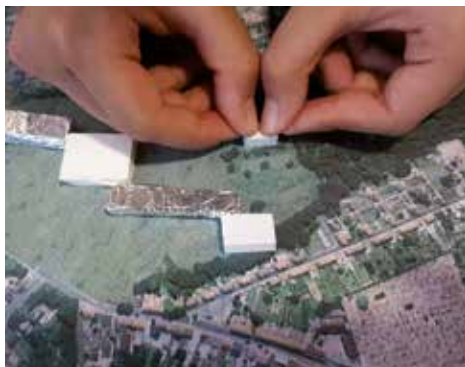
© V De Reu / CALL