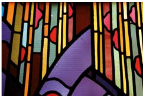
Détail vitrail SSM Lens